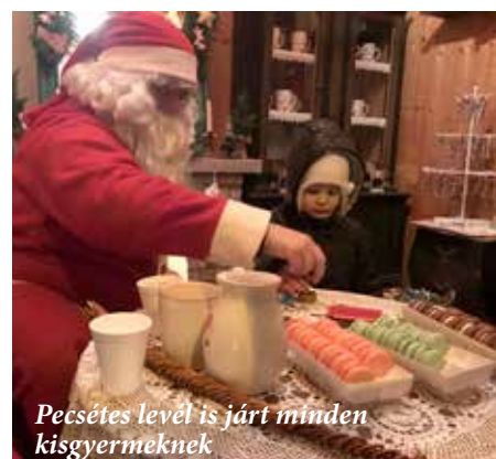
Pecsétes levél is járt minden kisgyermeknek