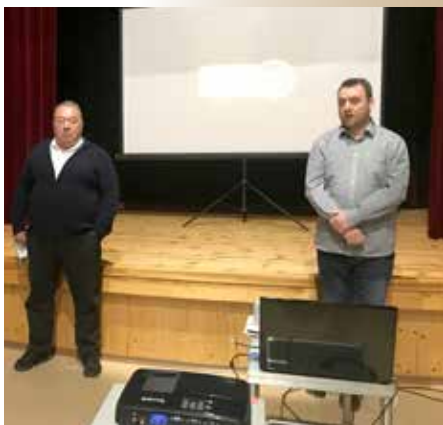
ALZHEIMER: A KÓR, AMIRŐL BESZÉLNI KELL