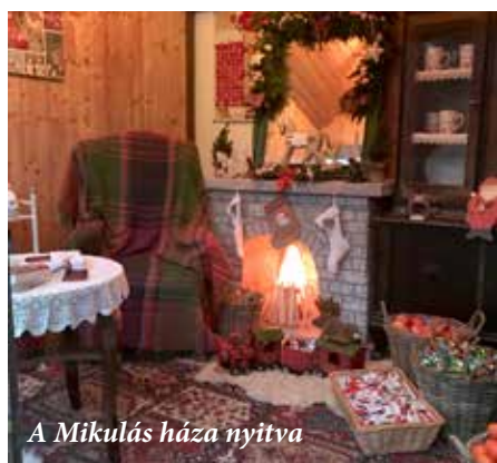
A Mikulás háza nyitva