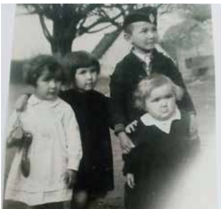
Emi néni és testvérei